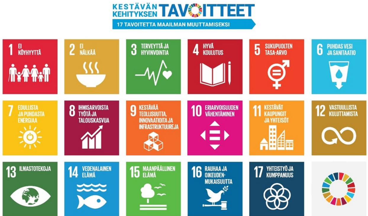
Kuva 1: Kestävän kehityksen tavoitteet.

Suomi on sitoutunut kaikessa toiminnassaan tukemaan Agenda 2030:n toteutumista niin kotimaassa kuin kansainvälisesti. Suomen keskeisiä kestävän kehityksen tavoitteita ovat naisten ja tyttöjen oikeuksien ja aseman parantaminen sekä demokratian ja hyvän hallinnon edistäminen. (Ulkoministeriö 2021.) Opinnäytetyöni keskittyy tarkastelemaan kestävästä kehityksestä erityisesti ekologisen kestävän kehityksen näkökulmasta.